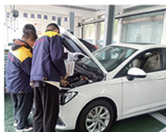
新能源汽车实训中心