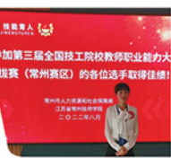
第三届教师职业能力大赛