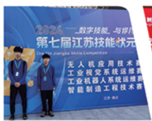
第七届江苏技能状元大赛