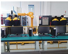
机器人智能制造实训中心