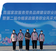
第二届巾帼家政服务大赛