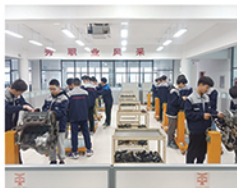
汽车维修实训中心