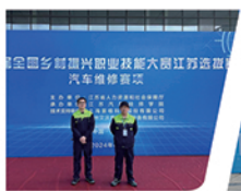
第二届全国乡村振兴职业技能大赛