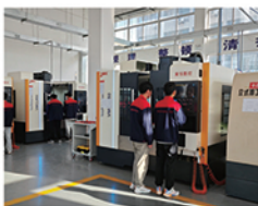
加工中心实训中心