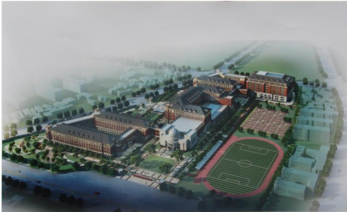
江苏省 2025 年度考录公务员笔试盐城市毓龙路实验学校考点平面图